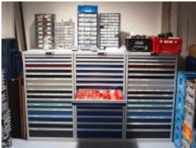
Die drei Schubladen-Schwestern