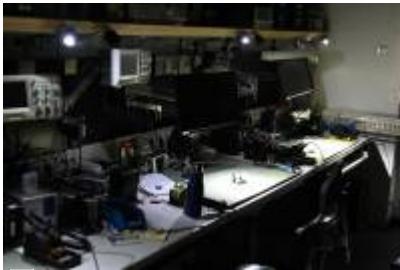
Arbeitsflächen im Rampenlicht

Die Arbeitsplätze sind jetzt mit jeweils zwei LED-Scheinwerfern ausgestattet, die selektiv den Arbeitsbereich ausleuchten. Das sollte bei der Montage kleiner Bauteile helfen. Vielen Dank an Fiene W. für die Montage!