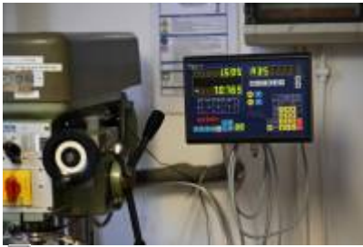
Bohren nach XY-Zahlen