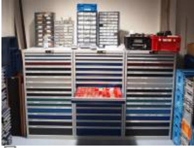
Die drei Schubladen-Schwestern

An einem der heißesten Tage dieses Sommers ist der Kleinteile-Speicher der ElektronIQ erweitert worden. Jetzt sind es drei Schubladenschränke, die außerdem noch platzsparender aufgestellt sind. Vielen Dank an die helfenden Hände und vor allem an Wolfgang für einen spontanen Elektriker-Einsatz zur Verlegung einer störenden Schukosteckdose. Der Inhalt der bisher aus Platzmangel in Stapelkisten gelagerten Kleinteile ist schon einsortiert. Was noch fehlt, sind aussagekräftige Schilder an den Schubladen.